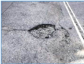
【舗装に穴があいている】