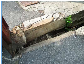
【側溝が壊れている】