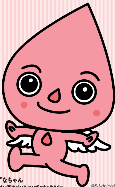
きずなちゃん 公的さい帯血バンク シンボルキャラクター